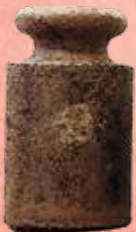
6000 KILO (A)