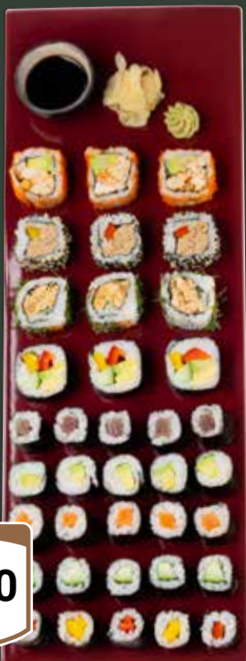
Maki-Set mit Lachs, 1 kg = 35.24